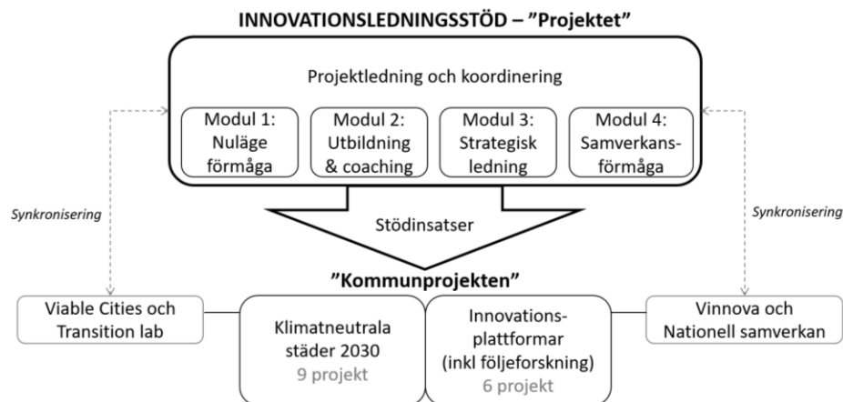
Figur 1: Illustration av innovationsledningsstöd (Projektet), Kommunprojekten och omkringsliggande aktörer och initiativ

I figur 1 illustreras omfattningen av Projektet samt dess koppling till Kommunprojekten, Vinnova och Viable Cities. En nära dialog mellan samtliga inblandade aktörer är en förutsättning för ett lyckat projekt.